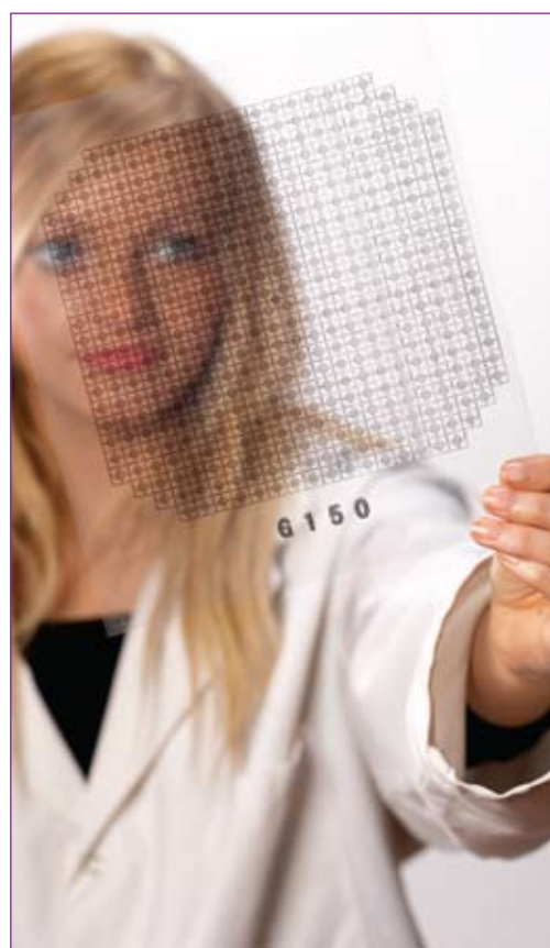
Piastre Iwaki da 35mm con coperchio (sinistra) e dettaglio ingrandito della griglia (destra)